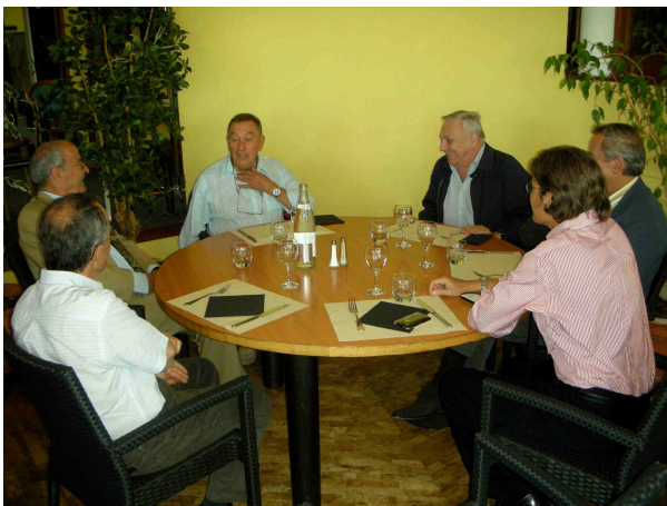
A la pose repas, les histoires continuent