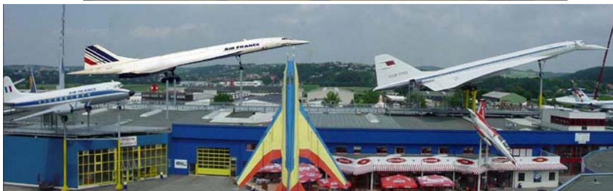
"Zukunftsvision" - Fotomontage unserer Concorde F-BVFB mit ihrer Konkurrentin aus dem Osten, der Tupolev TU 144

Nous vous invitons à aller visiter le Site Internet du Musée Sinsheim :